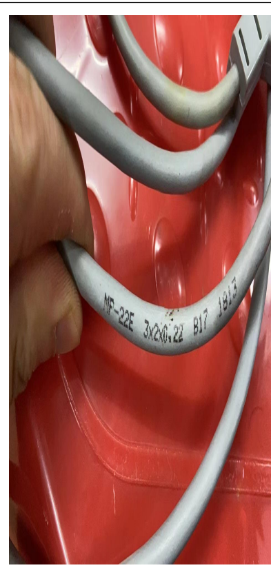
盆底神经肌肉刺激治疗仪导联线