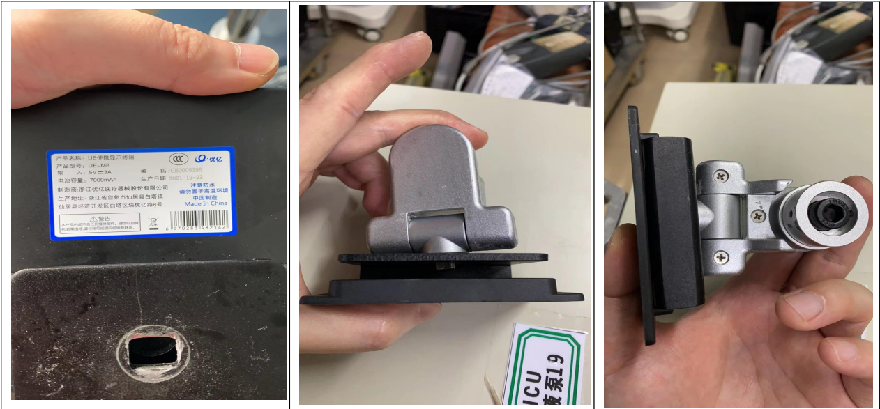
纤支镜显示屏固定底座