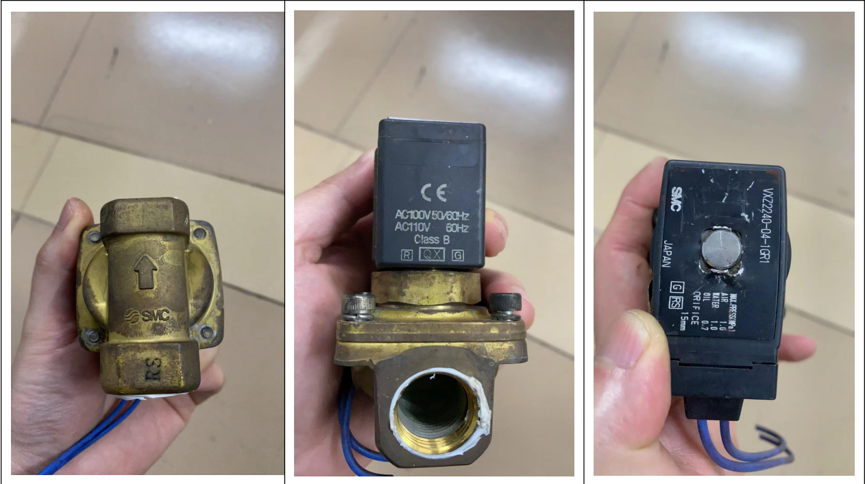
内镜清洗消毒机进水阀